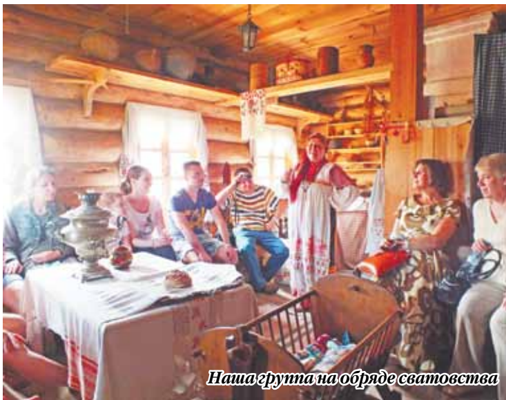
Наша группа на обряде сватовства