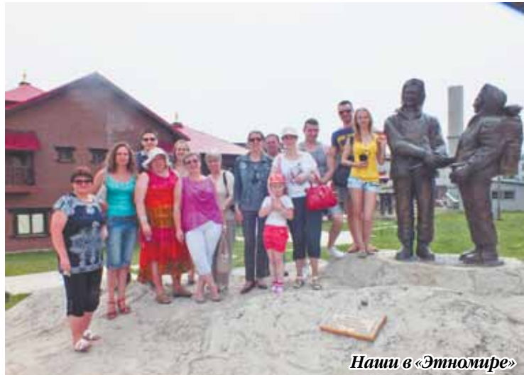
Наши в «Этномире»

Все, что в этот день происходило в «Этномире», так или иначе,