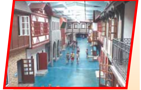
Второй год подряд управа нашего района дарит семейным парам Ясенева подарок-впечатление — поездку в культурно-образовательный центр «Этномир» на свадебный фестиваль.