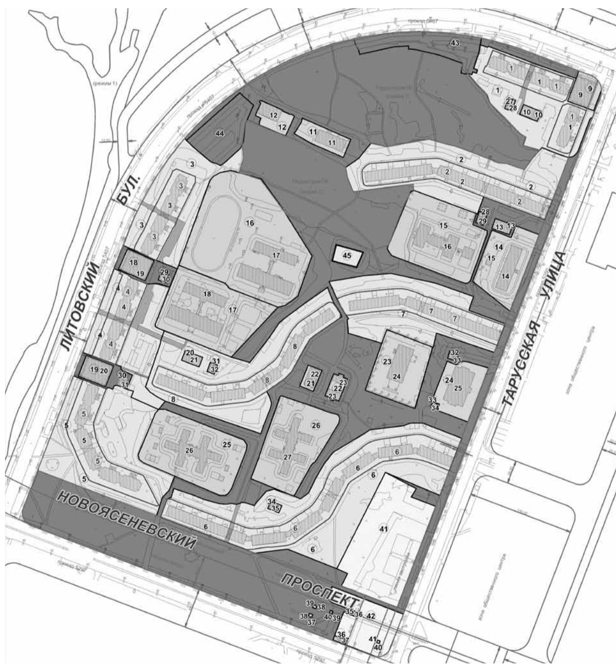
ХАРАКТЕРИСТИКИ ЗЕМЕЛЬНЫХ УЧАСТКОВ, УСТАНОВЛЕННЫХ ПРОЕКТОМ МЕЖЕВАНИЯ